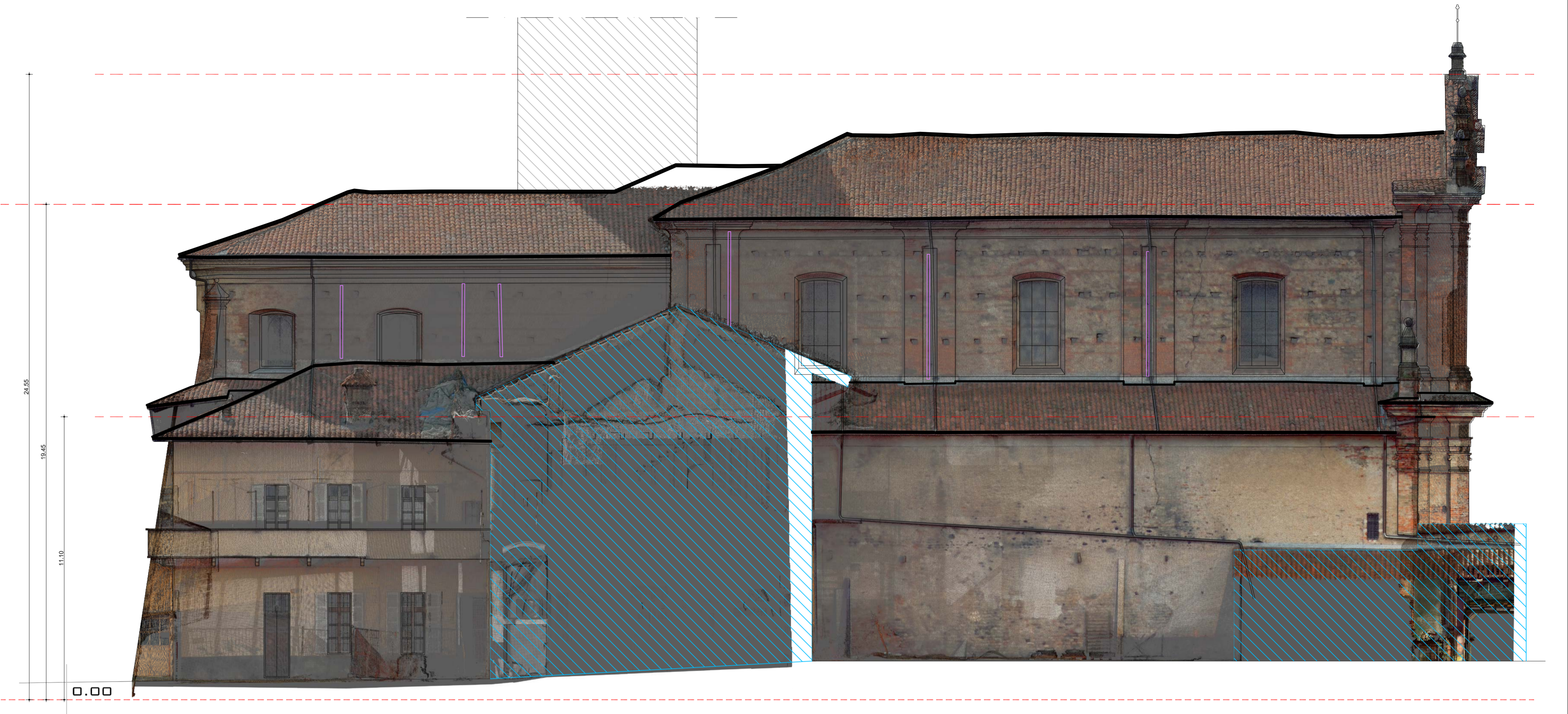
PROSPETTO NORD - SCALA 1:100