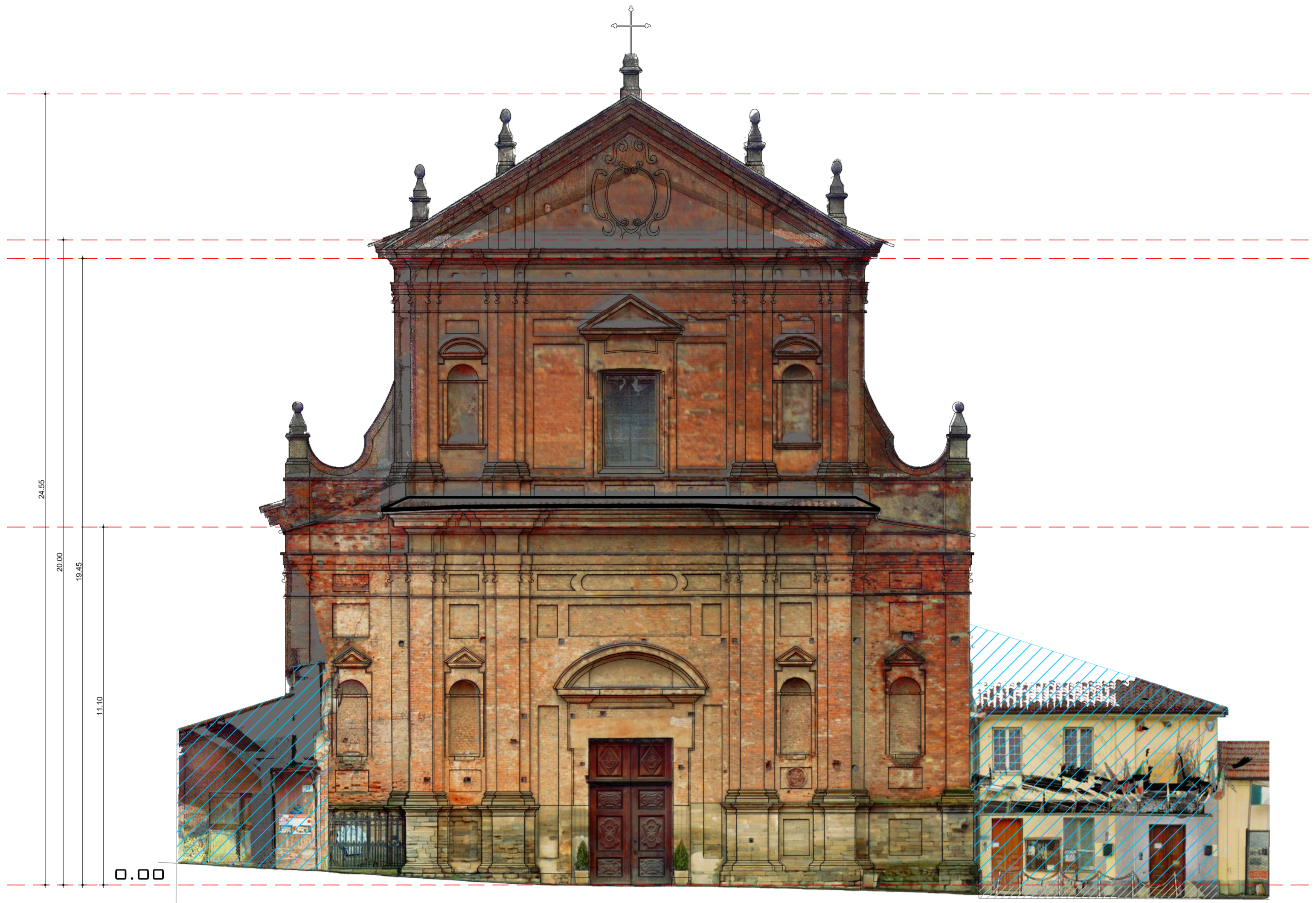
PROSPETTO OVEST - SCALA 1:100